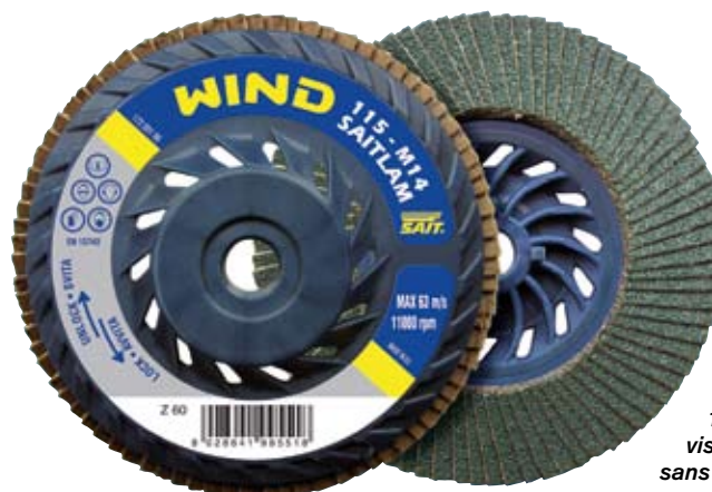
Wind, un disque à lamelles de toile abrasive d'une utilisation universelle, se caractérise par un rendement optimal et une durée de vie élevée. Ce produit disponible dans les diamètres 115 et 125 mm se monte par vissage grâce à son filetage, sans écrou de serrage.

Outre une présence régulière auprès des distributeurs de la marque Sait et sa rapidité de livraison, la filiale française de Sait Abrasivi s'est attachée à développer de nombreux services à l'intention de sa