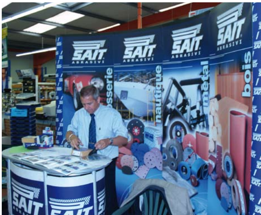
SAIT France apporte un soutien humain et matériel à ses distributeurs dans l'organisation de journées techniques.