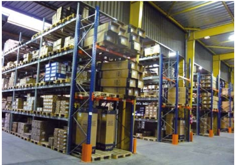
SAIT France peut livrer les commandes partout en France sous 24 à 48 heures grâce à une gestion automatisée du stock de Gonesse, dont vous avez ici un aperçu.

ration de disques plats de haute technologie proposée dans des diamètres de 115 et 125 mm et dans des épaisseurs de 1 mm et 1,6 mm répond à de nombreuses applications dans les secteurs de la métallerie et de la chaudronnerie. Des tests ont mis en évidence les excellentes performances de cette gamme obtenues grâce aux matières abrasives entrant dans leur composition et au process industriel mis en œuvre. Au chapitre de l'innovation technologique dont témoignent les meules résinoïdes SAIT, on peut également citer l'exemple du disque Tre, un produit lancé en 2010 qui bénéficie d'une technologie de fabrication inédite qui lui permet de réaliser l'ébarbage et le polissage sur l'acier, l'inox et l'aluminium. Côté abrasifs appliqués, l'autre spécialité du fabricant turinois, la gamme qui revêt toutes les formes possibles (disques, roues, feuilles, rouleaux, bandes et bandes larges) existe dans différents types de supports (papier, toile et fibre) et est élaborée à partir de grains abrasifs en corindon, zirconium, carbure de silicium et céramique. Cette gamme s'est elle aussi récemment élargie de produits innovants comme le disque à lamelles Wind dont la technologie permet une réduction de la température au niveau du point de contact pour créer des conditions d'utilisation optimales et le disque