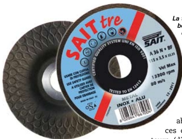
La technologie « goutte » dont bénéficie le disque Tre lui permet de réaliser l'ébarbage et le polissage de l'acier, de l'inox et de l'aluminium. Il est disponible dans les diamètres 115 et 125 mm.

clientèle de distributeurs. Ces services concernent notamment la formation théorique et pratique aux abrasifs techniques des forces commerciales des distributeurs (dispensée au siège de Sait France où chez ses clients), l'édition d'un guide technique, la possibilité de contacter facilement un conseiller technique ou encore l'organisation de tournées accompagnées avec les commerciaux de ces distributeurs.