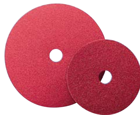
Le 9S est un disque auto-lubrifié en corindon céramique à support fibre possédant un pouvoir d'enlèvement élevé et un faible niveau d'encrassement et d'échauffement. Son utilisation est préconisée pour l'inox.

Pour apporter l'aide la plus efficace possible à son réseau de distribution, la marque italienne a choisi de privilégier les actions personnalisées aux actions nationales, telles des plaquettes et actions promotionnelles diverses grâce à un service marketing et communication interne dédié. Suivant la même logique, Sait France qui met à la disposition de ses clients tous les outils d'ALV et de PLV, peut concevoir avec ses revendeurs le type de linéaire répondant le mieux à leurs besoins, en fonction des différentes typologies de clientèles, réaliser le suivi et le réapprovisionnement des distributeurs ou encore assurer à ces derniers un soutien humain et matériel lors de l'organisation de journées techniques.